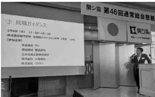
活路開拓委員会 活動報告