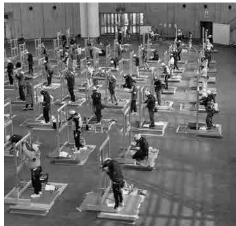
技能検定実技試験