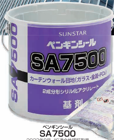
ペンギンシール SA7500 2023年8月 JIS適合性認証取得

カーテンウォール目地 金属・PCa・ガラス・タイル・コンクリート目地用 2成分形シリル化アクリレート