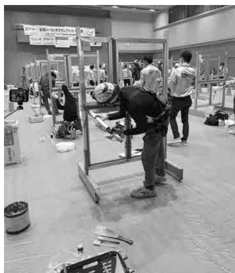
関西予選（競技の様子）