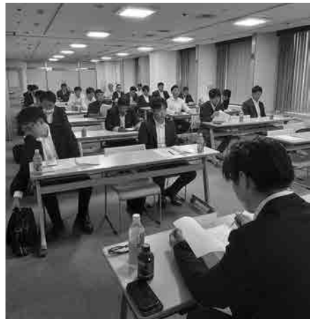
フューチャー会 総会 全景