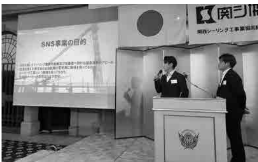
フューチャー委員会 活動報告