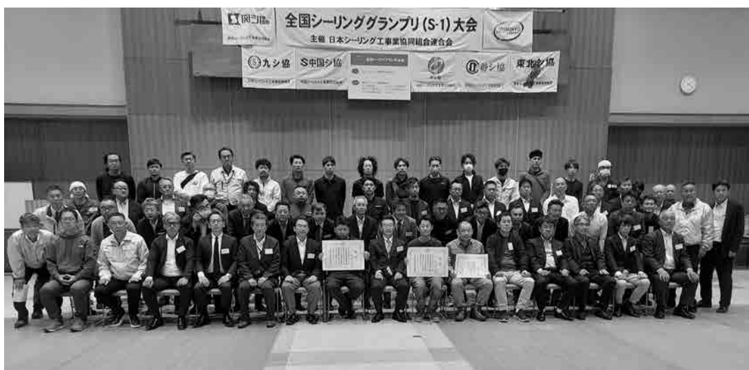
集合写真 参加者全員