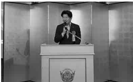
石川博崇参議院議員・挨拶