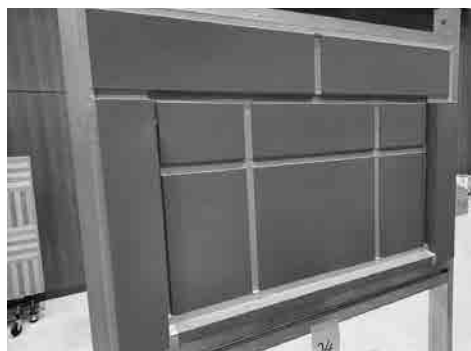
優勝者の制作架台