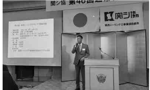
S1GP運営委員会 活動報告